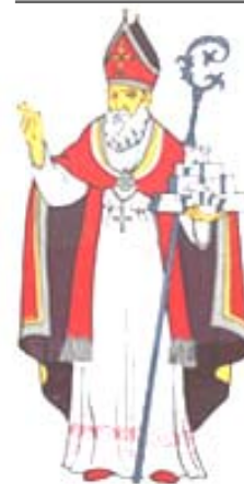
Sv. Blaž, – Vlaħo

Nije to bilo lako Isusu, koji je bio napastovan u pustinju, a u Maslinskom je vrtu s tjeskobom u srcu prihvatio žrtvu. Nije bilo lako ni nekim učenicima, koji su ga napustili jer nisu shvaćali što znači „vršiti volju Očevu“. Nije lako ni nama, budući da nam se svaki dan na pladnju nudi mogućnost odabira. „Moleći milost da možemo vršiti Božju volju“.